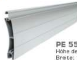
PE 55 Höhe des Profils: 55 mm Breite: 14 mm